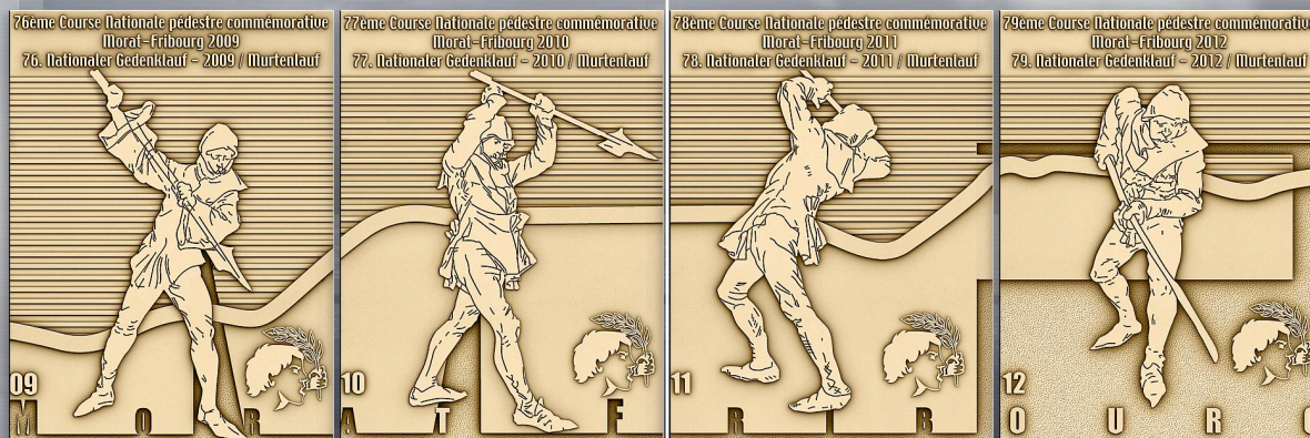
Revers de la série